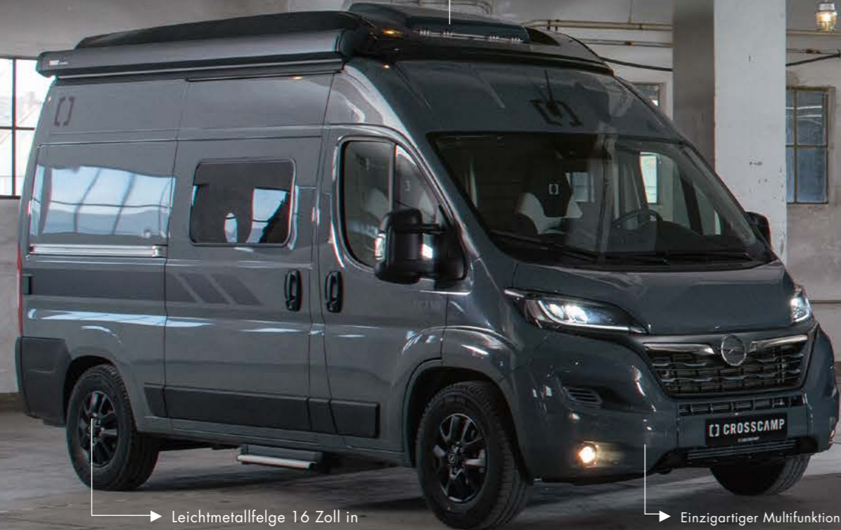
CROSSCAMP FLEX 541

Leichtmetallfelge 16 Zoll in Schwarz oder Silber (je nach Verfügbarkeit in der UNLIMITED-Edition, serienmäßig Stahlfelgen).