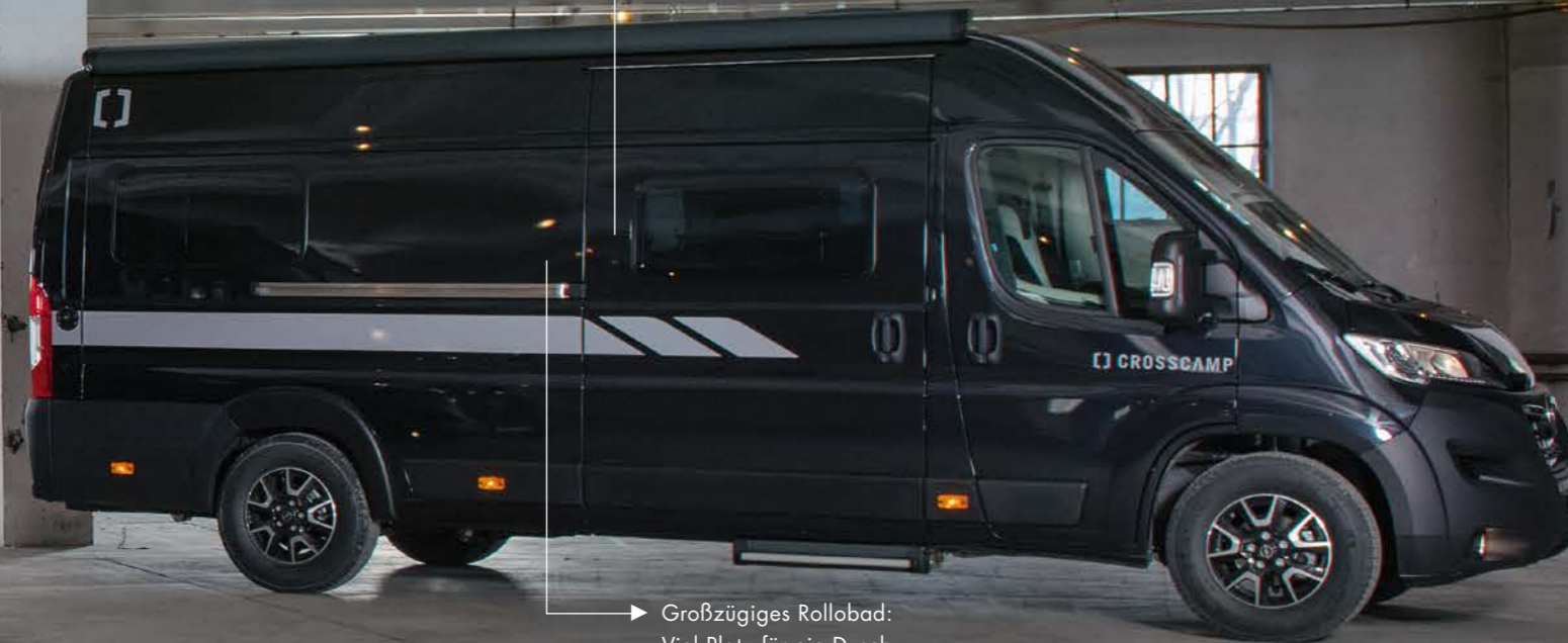
CROSSCAMP FULL 640

Lackierte Stoßfänger in Wagenfarbe (UNLIMITED-Edition) und LED-Tagfahrlicht.