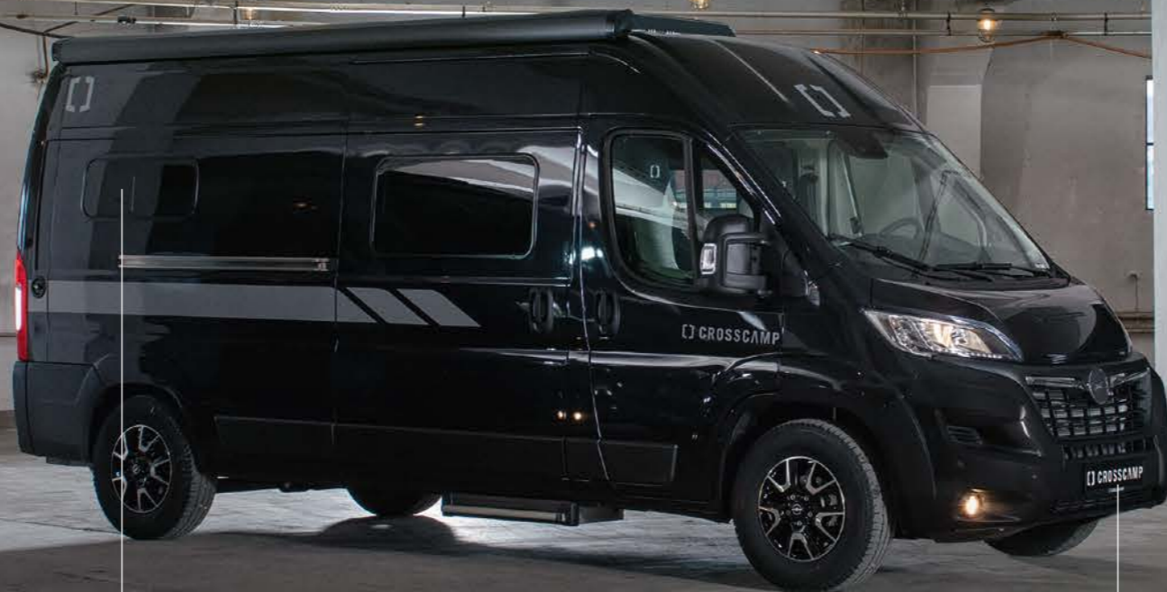
CROSSCAMP FULL 600

Dynamische Optik durch bündig integrierte, Rahmenfenster für leichteres Reinigen und verminderte Fahrgeräusche (UNLIMITED-Edition). Mit Fliegenschutz und Verdunklungsrollo in der Küche und an der Sitzgruppe.