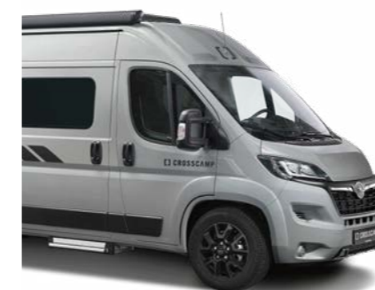
Artense Grau Metallic